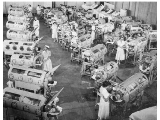
Une salle d'hôpital réservée aux poumons d'acier pour les petits poliomyélitiques